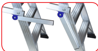
Maniglie ergonomiche chiudibili brevettate