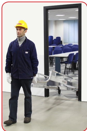
Facile da trasportare su ruote passa attraverso porte standard