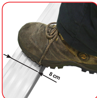
Gradini piani antisdrucchiolo