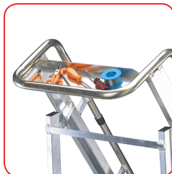
Vaschetta portattrezzi e portapacchi