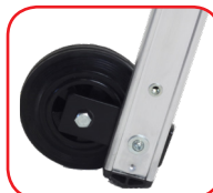
Rotelle di scorrimento Ø mm 150