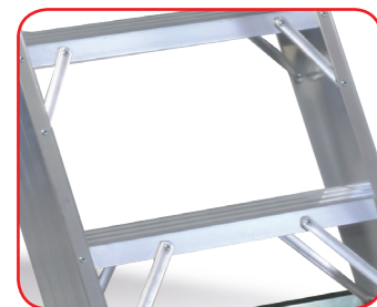
Rinforzi su tutti i gradini nei due lati