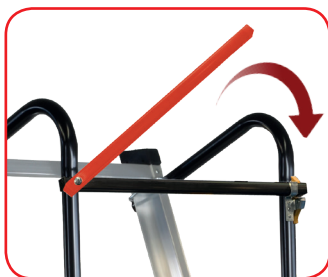
Nuova barra rigida posteriore