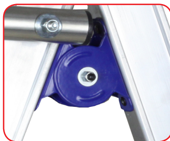
Cerniera maggiorata in acciaio