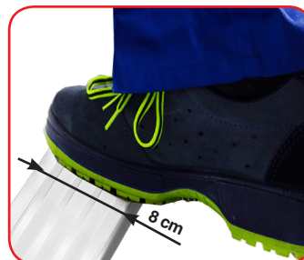
Gradino piano cm 8