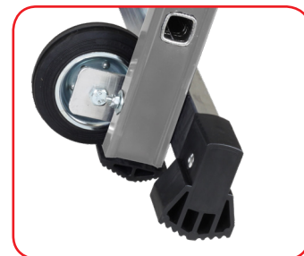
Ruota diam. 125 mm