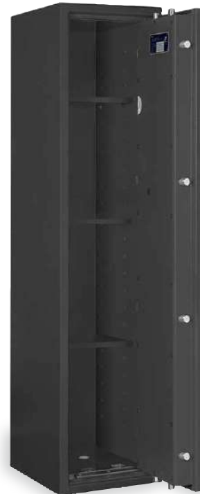
LB ZERO 11/C