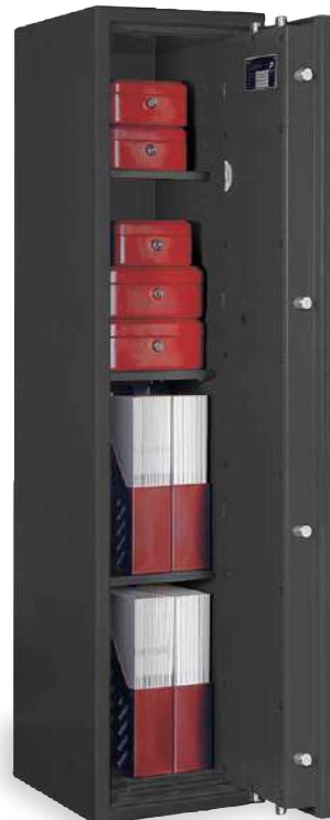
LB ZERO 11/C