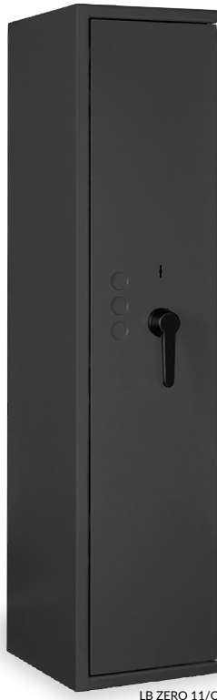
LB ZERO 11/C