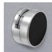
Mod. KC: LG3390+LG1730