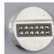
Mod. KE : EM2020+T6530