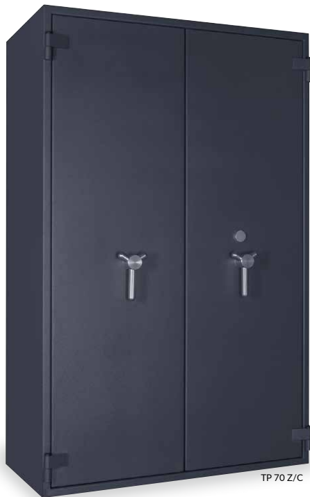
TP 70 Z/C